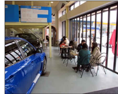
ショールームと商談