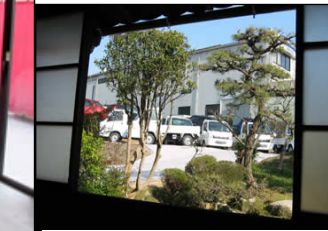
望桜荘 囲炉裏間から眺める専用展示

戦うインプレッサの象徴として産まれた世界限定400台の希少なクルマ。WRX 22B