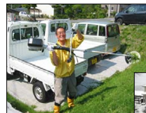
代田社長が率先し草刈り!