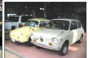
中津スバル 秘蔵のクルマ