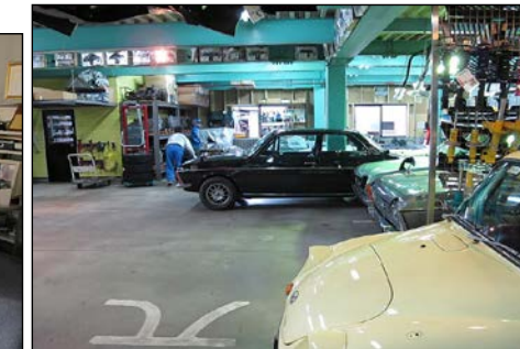
整備工場と作業風景