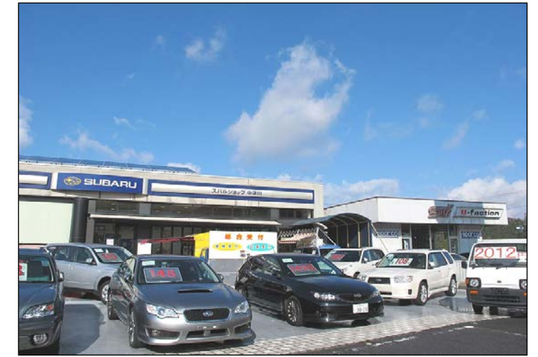
中津スバル販売 株式会社