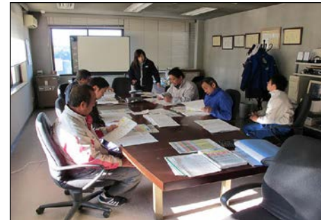
早朝会議でイベントを振り返り