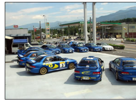
第4回22Bオーナーズミーティング