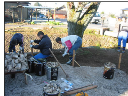
毎朝の活力朝礼で桜復活作戦を!